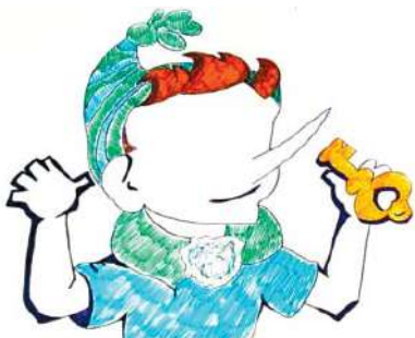
Рис. П2.3. Пример «Буратино»